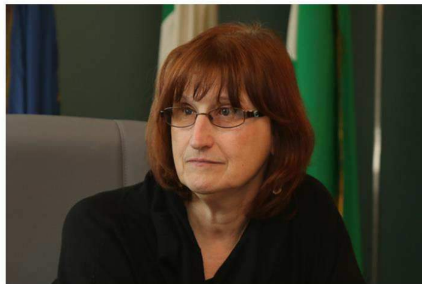
Il Sindaco di Lissone, Concettina Monguzzi

«La foto aggiornata al 30 giugno 2018 mostra l'immagine di una città laboriosa con 415 imprese per kmq sul territorio cittadino» – ha proseguito Concettina Monguzzi, sindaco di Lissone – “La città si conferma polo lavorativo all'interno del territorio brianzolo soprattutto nei settori dell'attività manifatturiera e del commercio. Inoltre il numero degli addetti impiegati a Lissone è in continuo aumento, avendo superato a giugno dello scorso anno le 20.000 unità».