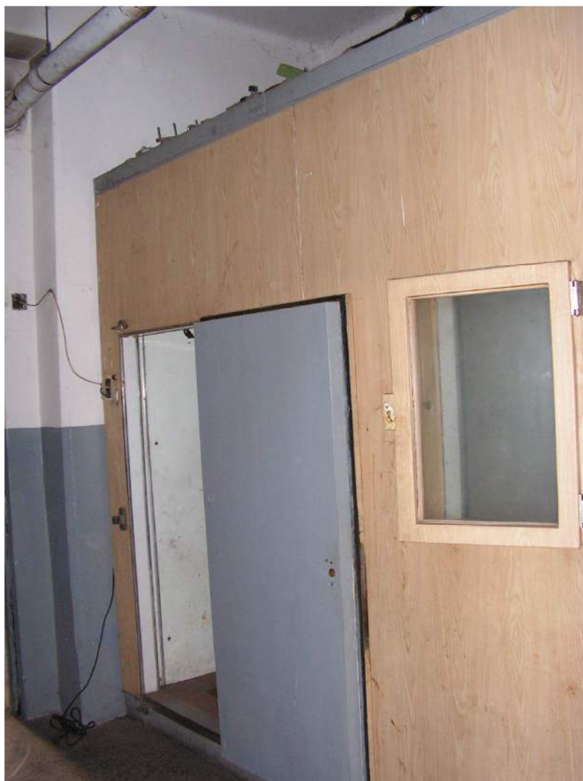
Vista interna retro.