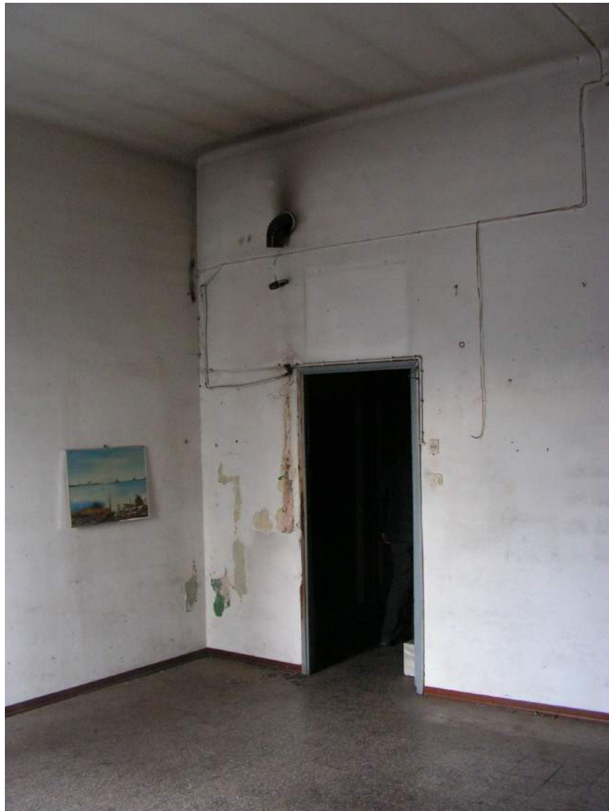
Vista interna negozio.

Comune di Lissone (MB) Via Gramsci, 21 – 20851, Lissone (MB) Settore Patrimonio Tel. 0397397386 e-mail: patrimonio@comune.lissone.mb.it