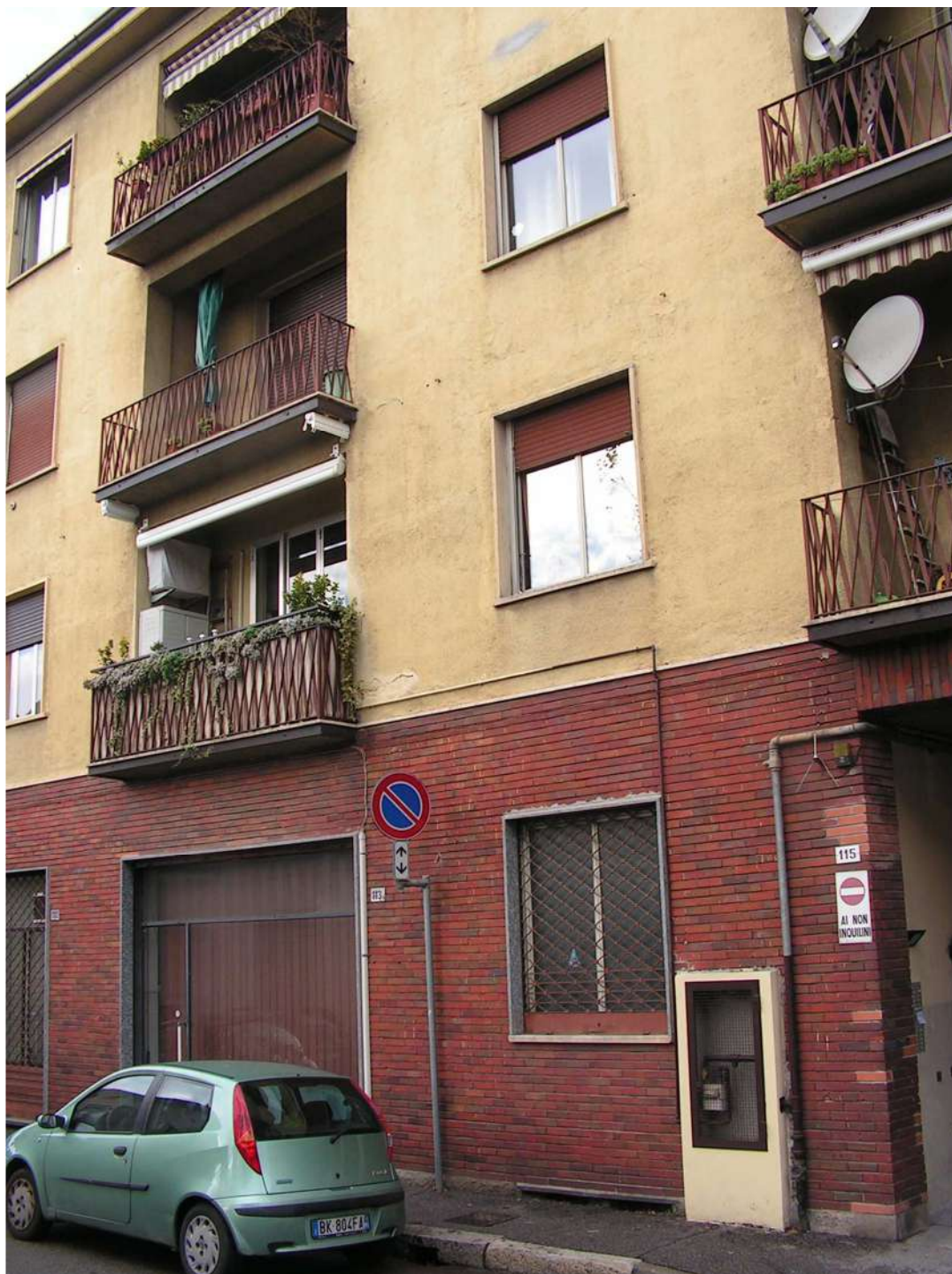
Vista esterna da via XX Settembre.