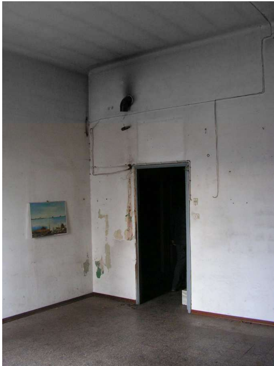
Vista interna negozio.

Comune di Lissone (MB) Via Gramsci, 21 – 20851, Lissone (MB) Settore Patrimonio Tel. 0397397386 e-mail: patrimonio@comune.lissone.mb.it