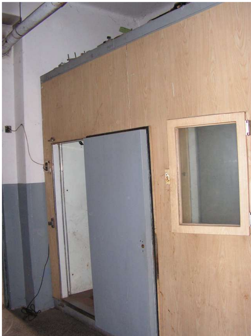
Vista interna retro.