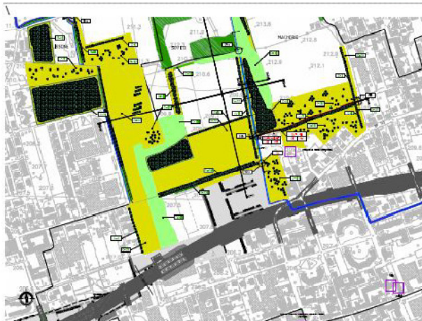
Progetto Locale 24

Relazione generale opere e misure di compensazione dell'impatto territoriale e sociale: Progetti locali