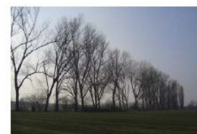
Filari e percorsi attorno all'oratorio di San Michele